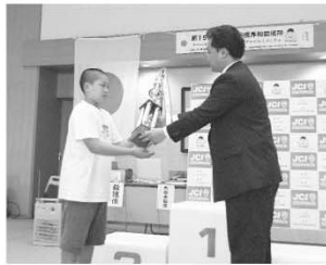
団体戦優勝校 光明小学校

今後とも、当岸和田青年会議所の諸活動にご理解、ご協力の程何卒宜しくお願い申し上げます。